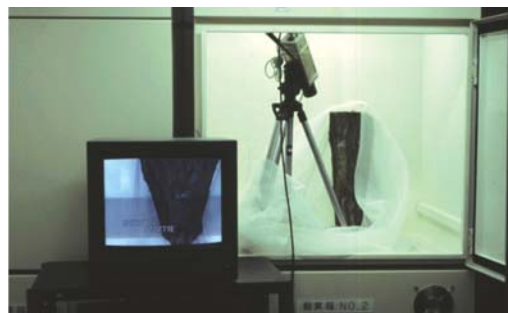
写真 カシノナガキクイムシ行動観察システム

まず初めに必要なのは明るさです。24℃の恒温室内で連続的に照度を変化させて、捕獲したカシノナガキクイムシ成虫の行動を観察したところ、0.01lux（ルクス）以下では飛翔行動は起こさず、緩やかに歩行するか正位（じっと静止している）状態ですが、1luxになると飛翔する個体が現れはじめ、100～1000luxでは活発に行動するのが観察されました。また、一定の明暗サイクル（明期：暗期=10時間：14時間）の日長制御恒温室内（25℃）に、カシノナガキクイムシが穿入・生育している丸太を置いて、そこから脱出する個体数を調査したところ、丸太からの脱出時間は明暗サイクルに同調しており、暗から明に変化した後の2～3時間に集中していました（写真）。これらのことから、カシノナガキクイムシの飛翔行動には、暗から明への明るさの変化が重要であると思われました。このことは、野外の網室で活動しているカシノナガキクイムシの捕獲数を時間毎に調査すると、夜明け直後から午前中にかけて活動していることか