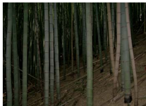
写真 放置され鬱蒼とした竹林

このように見てくると、一口に「竹」の研究といっても内容は多岐にわたります。問題解決のためには、造林や林業経営はもちろん、森林土壌、林業工学、防災、森林生物、林業薬剤など多様な分野の研究者の協力が欠かせないことがわかります。